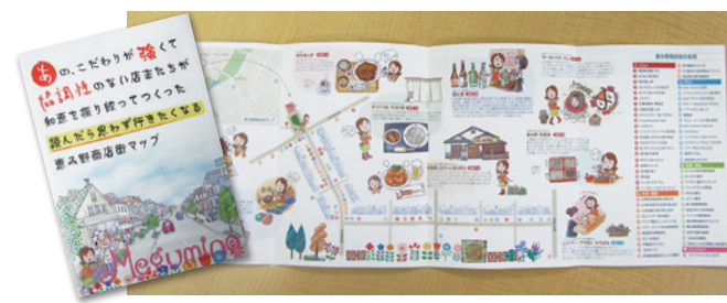
商店街役員と協働で商店街のエピソード満載のイラストマップ作成(恵庭市恵み野商店街)