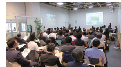
まちづくり研究会