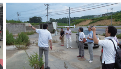
視察会(東北復興状況)