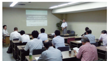
まちづくりゼミナール