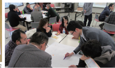
ワークショップ(防災・減災研究会)